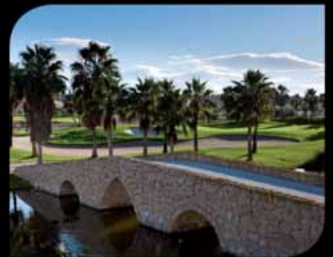
3. La Finca Golf