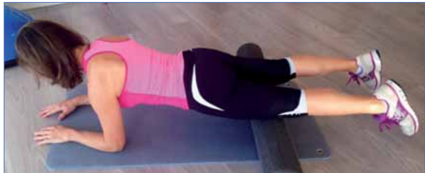
1 • CUADRÍCEPS

Como muestran las imágenes es importante que ruedes las zonas musculares sobre el Roller o Rulo sin llegar a las articulaciones.