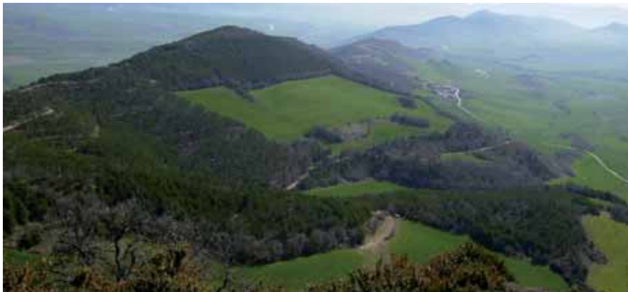
Valle de Aranguren