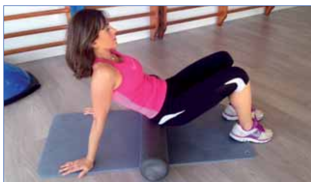
6 • ESPALDA (LUMBARES)