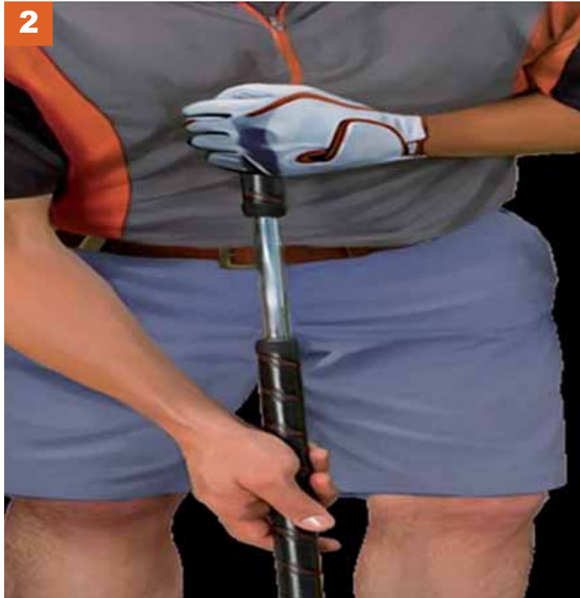
PUTTER LARGO (O ESCOBA)

El sujetar un antebrazo de forma intencionada contra el cuerpo solo se prohíbe cuando se hace para crear un punto de apoyo