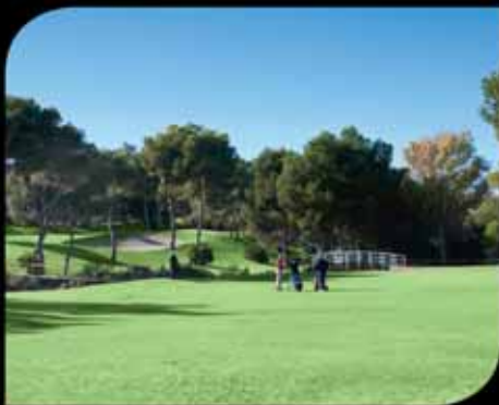
1. Villamartín Golf