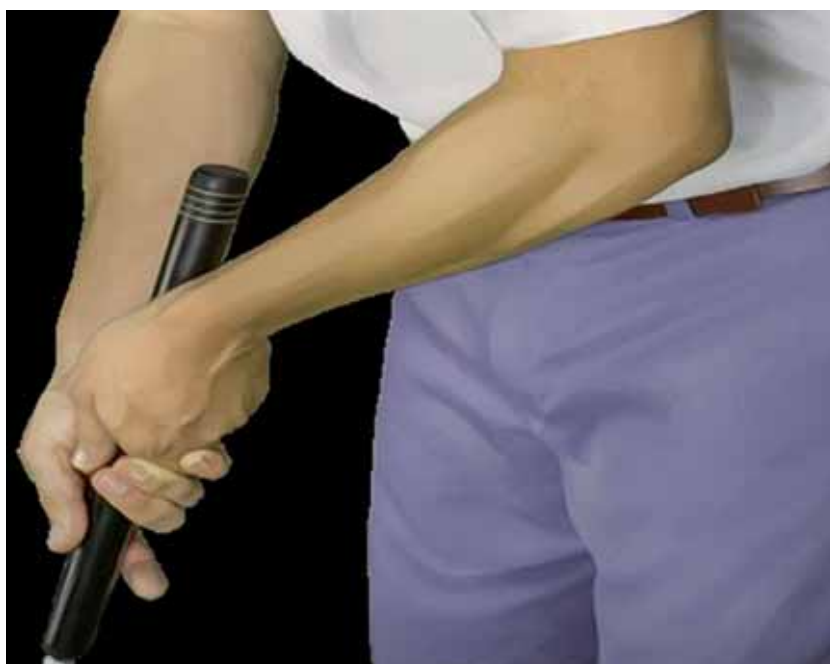
PUTTER DE BARRIGA (BELLY PUTTER)