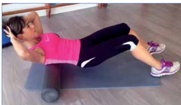
5 • ESPALDA (DORSALES)