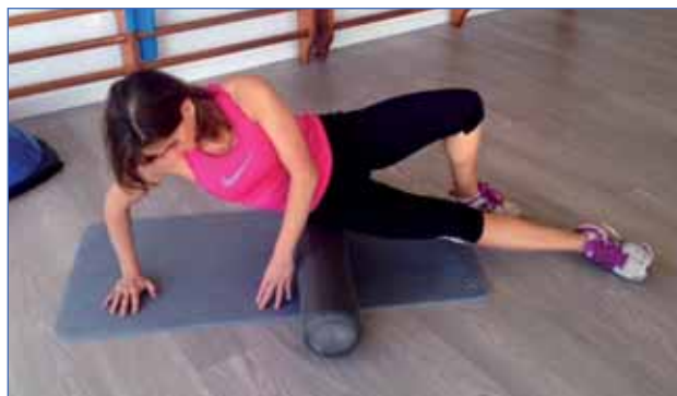
4 • TENSOR DE FASCIA LATA