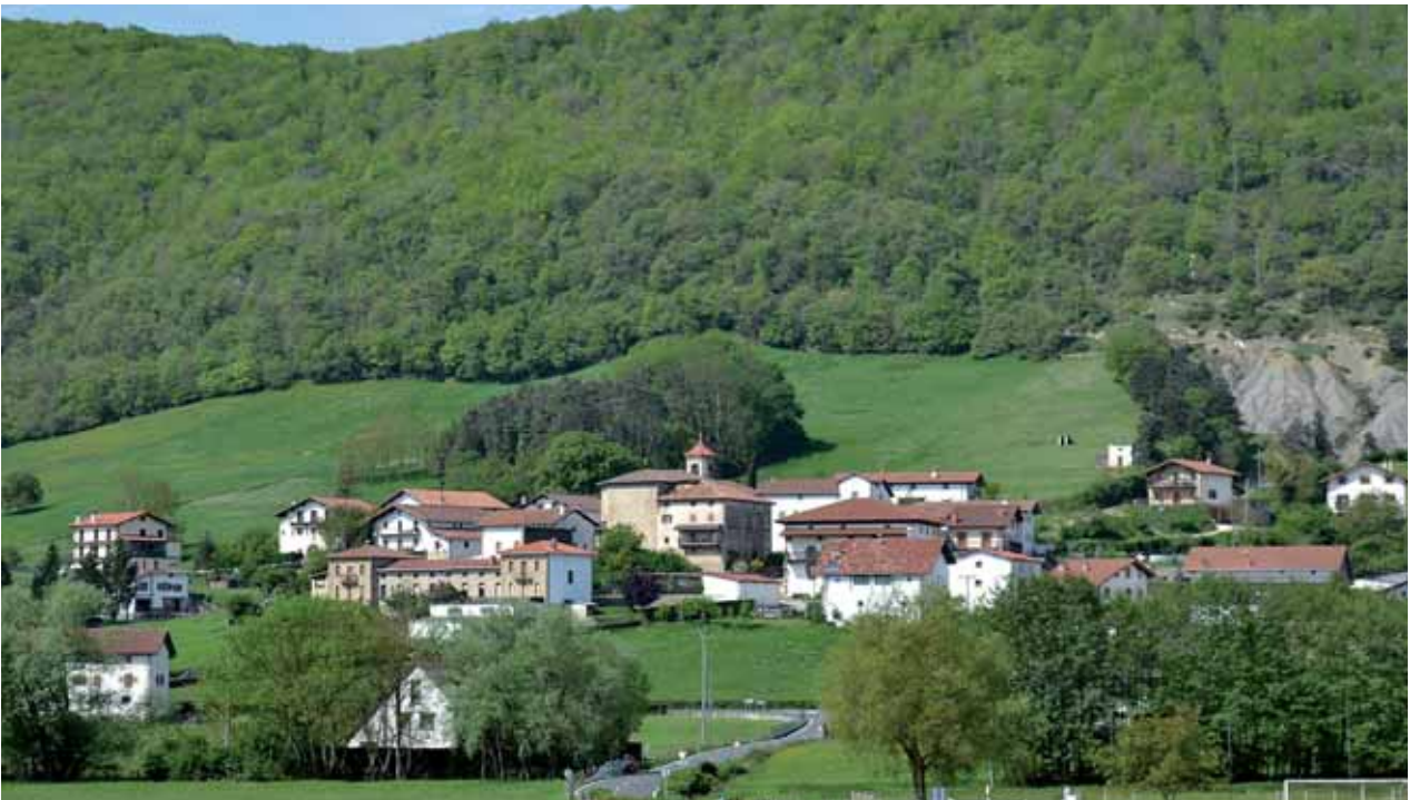
Valle de Ulzama

Existen numerosas maneras de visitar y descubrir la riqueza y diversidad de Navarra. Una de ellas es en dos ruedas. En la Comunidad Foral son innumerables los trazados para disfrutar del paisaje y la belleza natural en bicicleta de carretera