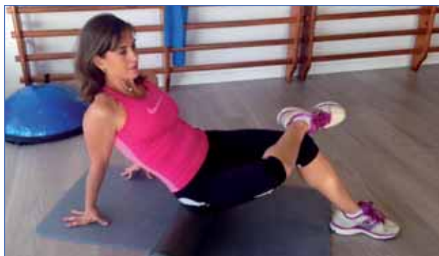
3 • GLÚTEO